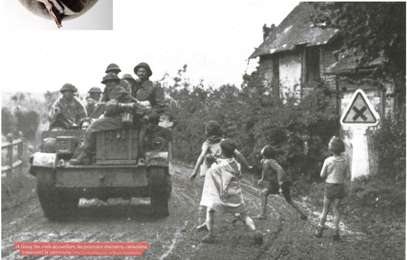
A Gouy les civils accueillent les premiers éléments canadiens traversant la commune.

Ci-dessous photo prise à l'entrée de GOUY en 1944 (carrefour rue de la République– rue de l'église) à l'occasion de l'entrée des troupes libératrices dans notre village quelques semaines après le débarquement.