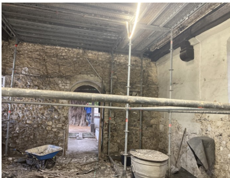
Photo 2 Murs nef

est nécessaire de poursuivre les investigations, il a donc été décidé de supprimer tout le plâtre et le lattis qui recouvrait la charpente de la nef (Photo 1). Le revêtement des murs semblant fortement dégradé par la présence d'humidité, les murs de la nef ont totalement été décrépés. Cette opération a permis de confirmer la solidité des murs et l'absence d'humidité dans ces derniers. Des travaux de drainage autour de l'édifice vont être réalisés prochainement.