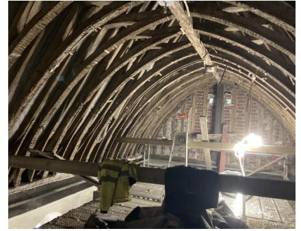
Photo 1 charpente